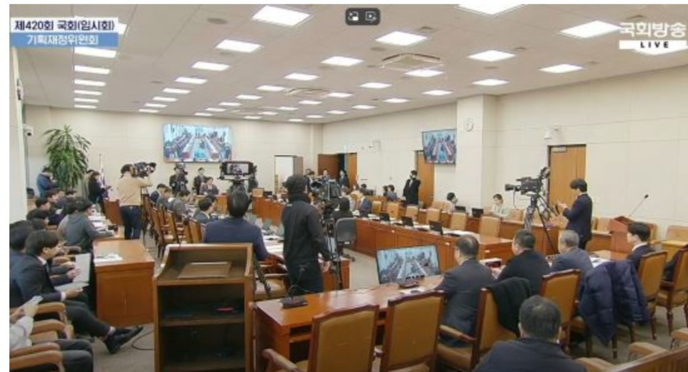
▲ El 27 de diciembre del año pasado, el Comité de Planificación y Finanzas de la Asamblea Nacional celebró una audiencia pública sobre la "Enmienda a la Ley de Negocios del Tabaco" en la Asamblea Nacional y escuchó opiniones para "legislar los cigarrillos electrónicos líquidos hechos de nicotina sintética, etc. para incluir el tabaco".

El 27 de diciembre del año pasado, el Comité de Planificación y Finanzas de la Asamblea Nacional celebró una audiencia pública sobre la enmienda a la Ley de Negocios del Tabaco en la Asamblea Nacional y escuchó opiniones sobre la legislación para incluir tabaco en los cigarrillos electrónicos líquidos hechos de nicotina sintética. Los temas clave en esta audiencia pública sobre la enmienda a la Ley de Negocios del Tabaco son △ el hecho de que el 98% de la nicotina sintética vendida comercialmente es falsa △ la confirmación de las razones y los antecedentes de los claros pros y contras de la enmienda △ la "nicotina sintética" El servicio de investigación de nocividad, que es la base principal de la legislación sobre cigarrillos de nicotina sintética, .